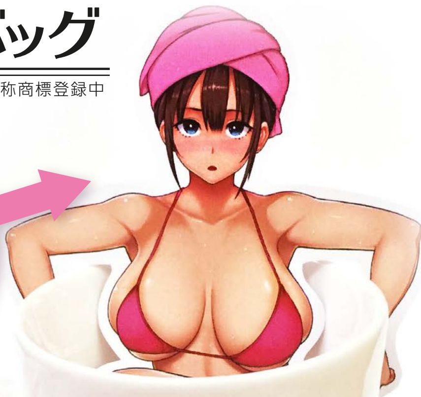
illustration by メメ50